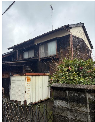
現状を優先します